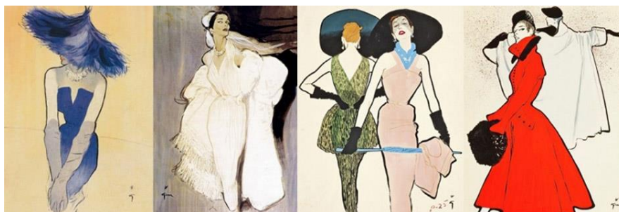
Рис. 4. Ілюстрації Р. Грюо

Стрімко розвиваючись, індустрія моди приваблювала знаних митців, які знайшли нові втілення своєму неперевершеному стилю. Обкладинки журналу «Vogue» у 1938, 1944 і 1971 рр. демонструють високу майстерність С. Далі., до сьогодні залишаючись шедеврами, що ілюструють історію моди (рис. 5).