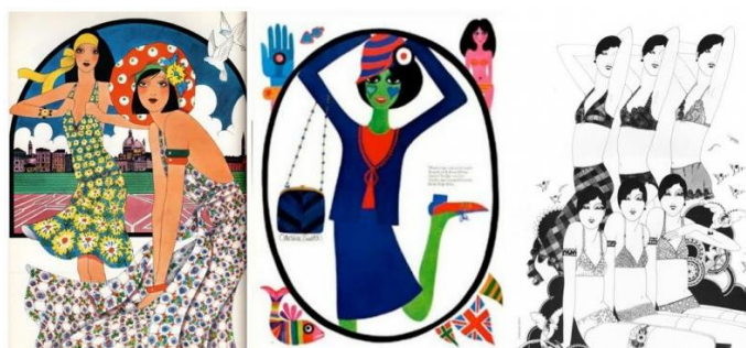
Рис. 6. Ілюстрації К. Сміт

Початок 60-х рр. ХХ ст. став кінцем епохи fashion-ілюстрації як основної форми візуалізації образів в глянцеvih журналах. У цей непростий для ілюстраторів індустрії моди час, заявляє про себе К. Сміт (рис. 6), яка черпала натхнення в картинах поп-арту, яскравих символах і геометричній графіці. Вона була головним ілюстратором в таких виданнях, як «Vogue», «Harper's Bazaar», «Queen», «Elle».