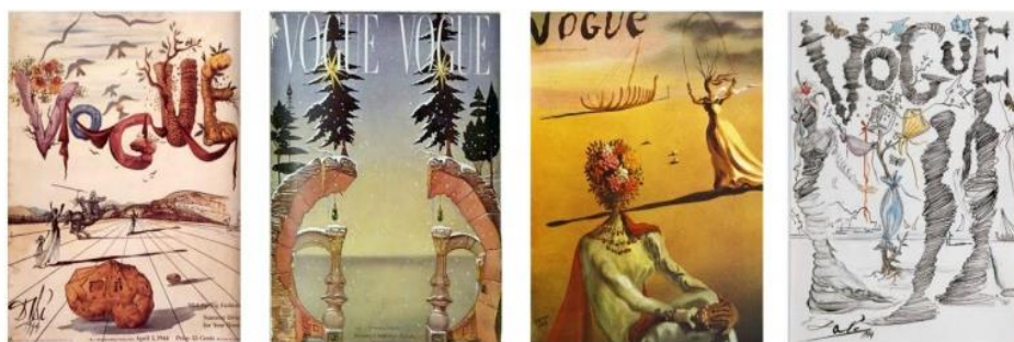
Рис. 5. Ілюстрації С. Далі

Стрімко розвиваючись, індустрія моди приваблювала знаних митців, які знайшли нові втілення своєму неперевершеному стилю. Обкладинки журналу «Vogue» у 1938, 1944 і 1971 рр. демонструють високу майстерність С. Далі., до сьогодні залишаючись шедеврами, що ілюструють історію моди (рис. 5).