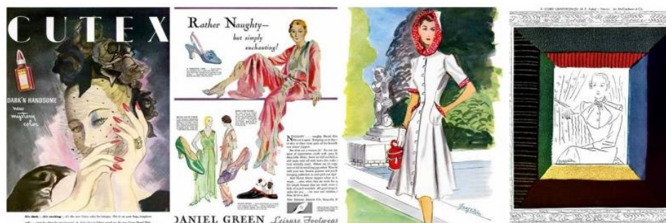
Рис. 3. Ілюстрації Р. С. Графстр

Роботи Рут (рис. 3) стали з'являтися в журналі «Vogue» з 1933 р. та відрізнялися рисами стилю фовізм [6]. Динамічність мазка, яскравий колорит, контраст, виявлення форм контуром та узагальнення простору все це притаманно ілюстраціям Р. Сіґріда.