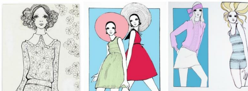
Рис. 7. Ілюстрації Б. Хілсон

Ще однією художницею, яка працювала в напрямку fashion-ілюстрації, стала Боббі Хілсон (рис. 7). Вона відзначилася завдяки мальованим репортажам з модних показів, коли фотографи ще не запрошувалися на шоу. Її стиль характеризується лінійною графікою та мінімалізмом. Боббі малювала для «Vogue», «The Sunday Times» і «The Observer».