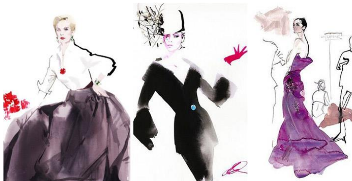
Рис. 9. Ілюстрації Д. Даунтона

«Harper's Bazaar», «STYLE» тощо. Д. Даунтон продовжує і зараз створювати свої графічні шедеври для обкладинок журналу «Vogue» (рис. 9) [4].