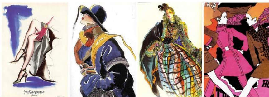
Рис. 8. Ілюстрації А. Лопеса

Одним із найвпливовіших ілюстраторів того часу був А. Лопес (рис. 8). Його стиль – це мікс коміксів з натхненням, отриманим від робіт ілюстраторів «золотої епохи». Роботи Лопеса прикрашали «Vogue», «Harper's Bazaar», «Elle», «Interview», «The New York Times».