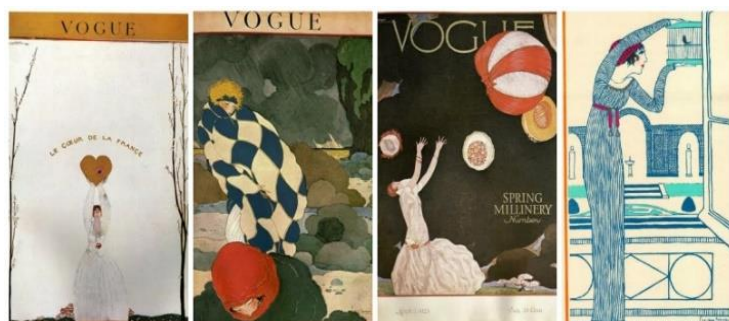
Рис.1. Ілюстрації Ж. Лепаса

У 1910-1920 рр. обкладинки журналу «Vogue» прикрашали роботи Ж. Лепаса (рис.1), який був одним з найвідоміших художників і сценографів першої половини ХХ ст. Для журналу він створив близько 100 обкладинок. Також Лепас співпрацював з журналами «Harper's Baazar» та «Femina». Стиль Ж. Лепаса характеризувався виразним декоративним рішенням, обмеженою палітрою кольорів та плоским зображенням жіночої фігури [1].