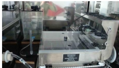
Рисунок 2 – Зовнішній вигляд приладу SGHP-8.2 (США) для визначення паропроникності текстильних матеріалів

Вимірювання паропроникних властивостей білизняних текстильних матеріалів здійснювалося методом «потіючої теплої пластини» (ДСТУ ISO 11092:2005) [1] на приладі SGHP-8.2 (США) (рис.2). Випробування проводилися при безпосередньому контакті текстильного матеріалу з вологою «потіючою» поверхнею. Під час дослідження враховувалася загальна маса пароподібної вологи (поглинутої та пропущеної), яка характеризувала здатність текстильного полотна видаляти вологу з підодягового простору. Умови випробування: T_{\text{повітря}} = T_{\text{пластини}} = 35^{\circ}\text{C} = \text{constant} ; відносна вологість повітря \varphi = 40\% ; швидкість повітря v = 1 м/с; температура води T_{\text{води}} = 35^{\circ}\text{C} .