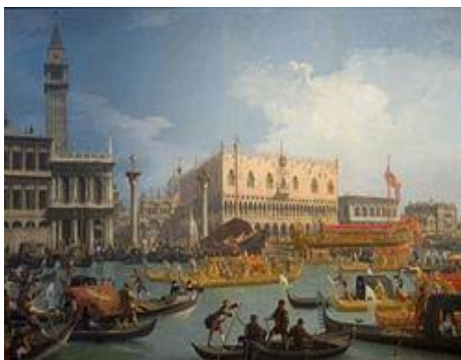
Рис.1 Антоніо Каналетто. Виїзд венеціанського дожа на заручення з Адріатичним морем

Результати дослідження. Століття раціоналізму і фантазії, історії і театру привело до появи основного типу міського пейзажу. Перший ведут, ставив собі за мету точну фіксацію певного міського виду. Тут просторові співвідношення завдяки правилам лінійної перспективи переважно дотримувалися [1].