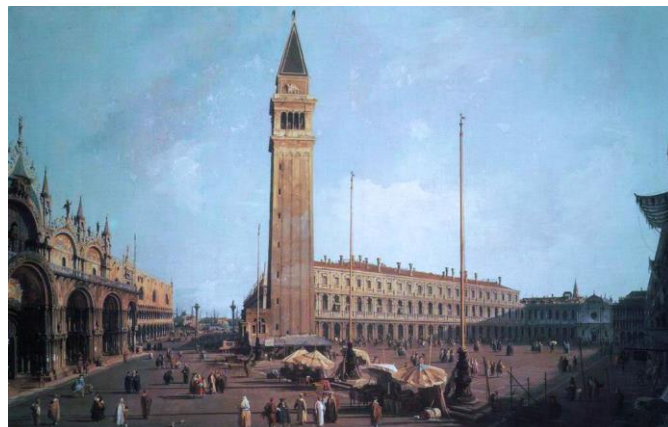
Рис.4 Антоніо Кавалетто, П'яцетта.

Але так ясніше те, на чому слід зосередити свою увагу.