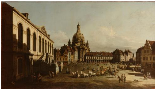
Рис.2 Бернардо Белотто. Майдан Нового ринку у Дрездені

на церкву Санта Марія дела Салюте. Вдало обрана точка зору дозволяє глядачу бачити декілька сюжетів уславлених шедевривенеціанської архітектури.