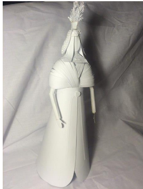
Іл. 2. Макет на основі елементів давньоєгипетського жіночого костюма

Висновки. Під час дослідження було знайдено та проаналізовано творче джерело й обрано саме ті форми та елементи костюму, які найбільш повно відповідають історичному періоду єгипетської цивілізації; виконано макет жіночого костюма.