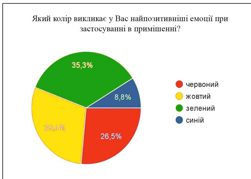
Рис. 2. Визначення найбільш сприятливого кольору для підлітків

В ході проведення дослідження було виявлено, що найбільш позитивний вплив на підлітків мають відтінки зеленого кольору в інтер'єрі (рис. 2). Також досить велика частина вважає, що позитивні емоції викликає використання відтінків жовтого та червоного кольору. Натомість, синій колір не викликав великої кількості приємних вражень.