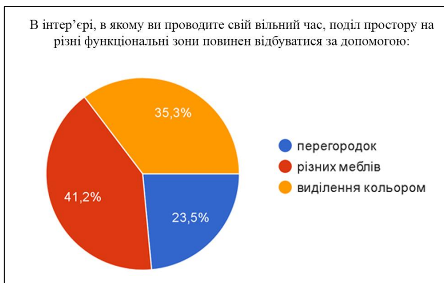
Рис. 3. Визначення оптимальних прийомів функціонального зонування для центрів розвитку підлітків

Серед опитаних підлітків 41,2% вважають, що поділ простору на різні функціональні зони слід робити за допомогою меблів. 35,3% вважають за краще робити зонування за допомогою кольору. Однак 23,5% притримується більш звичної моделі і хотіли б бачити розподіл на зони за допомогою перегородок (рис. 3). Це говорить про те, що більшість підлітків хотіли б проводити свій вільний час у просторі не заграмадженому зайвими деталями та більш відкритому.