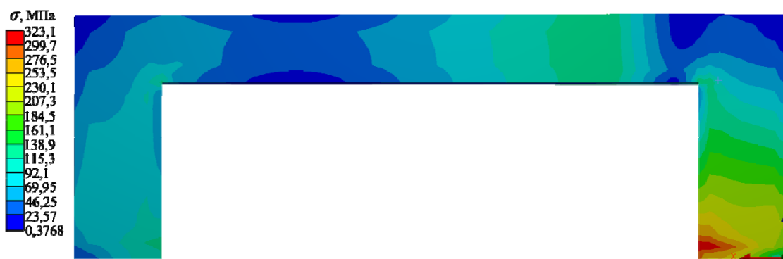
Рис. 3. Розподіл еквівалентних напружень \sigma за Мізесом в клині при дії навантаження P = 14 Н

За результатами виконаних обчислювальних експериментів були визначені розподіли еквівалентних напружень за Мізесом та деформацій в клині, приклади яких показано на рис. 3 і 4 відповідно.