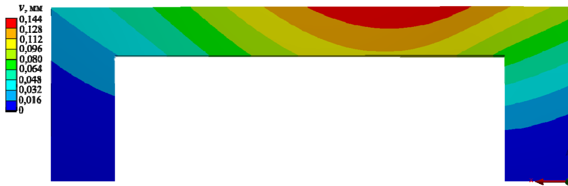
Рис. 4. Розподіл прогинів u в клині при дії навантаження P = 14 Н

З представлених даних видно, що максимальні напруження спостерігаються на правій консольній балці клину біля защемлення, при цьому максимальний прогин відбувається по грані взаємодії п'ятки голки з робочою гранню. Такий характер розподілів вказаних характеристик збігається з проведеними раніше аналітичними розрахунками [6]. Також отримано наближені до оптимальних геометричні параметри клину, які задовольняють вимоги за податливістю та міцністю, а саме b = 3 мм, h = 0,7 мм та B = 3,3 мм.