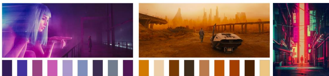
Рис. 1. Аналіз кольору в фільмах та мистецтві напрямку футуризм

Щоб обрати основну кольорову гамму колекції, було проведено соціологічне опитування та проаналізовано найбільш яскраві приклади зображень в мистецтві та кіно напрямку футуризм. На основі чого було виділено основні кольори колекції, що символізують вогні нічного міста-майбутнього.