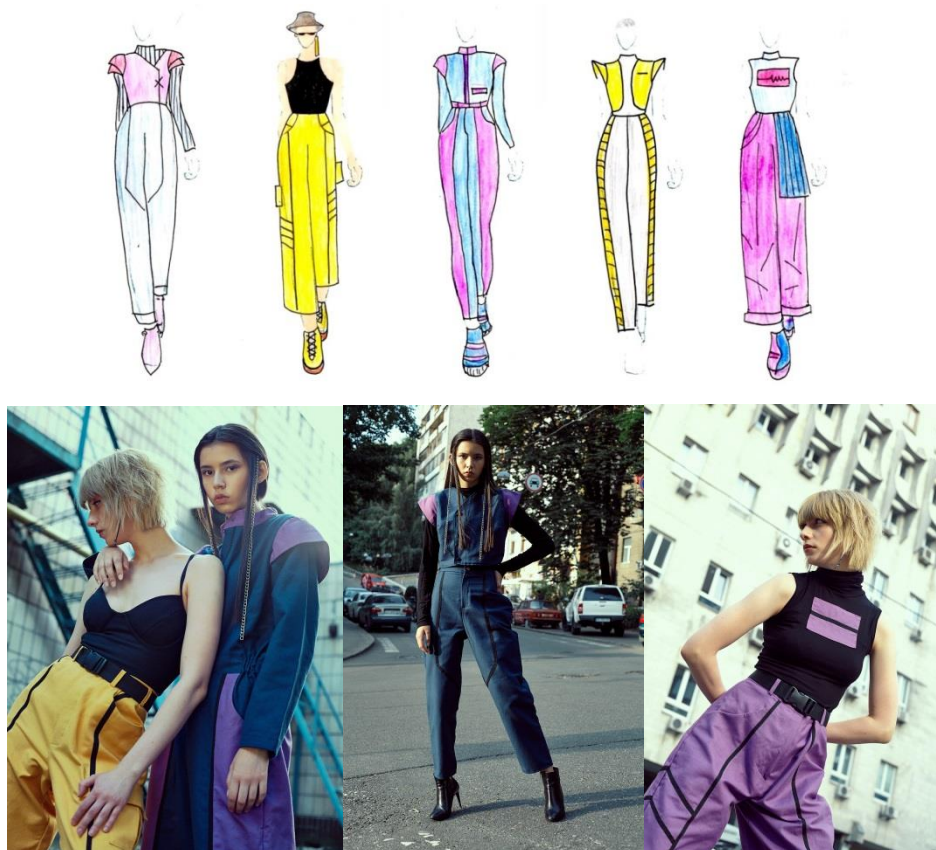
Рис. 2. Моделі та ескізи виготовленого одягу

Моделі одягу нагадують робочі комбінезони, аби підкреслити зручність та практичність виробів (рис. 2). Також, для деяких моделей брюк, було розроблено та виготовлено ткані ремені на застібках-фастексах.