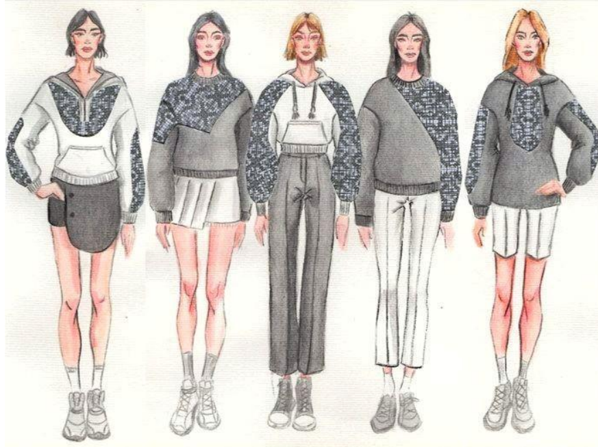
Pic. 2. Collection sketch

The developed collection is a designer one, suitable for everyday life, rest and work, if there is no hard dress code. It is designed for young women from 18 to 30.