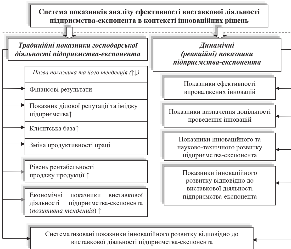
Рис. 2. Методика аналізу виставкової діяльності підприємства-експонента в контексті інноваційного розвитку Джерело: розроблено авторами

Джерело: систематизовано авторами на основі [1; 5; 7; 12; 13; 16–18; 20–23; 27–31]