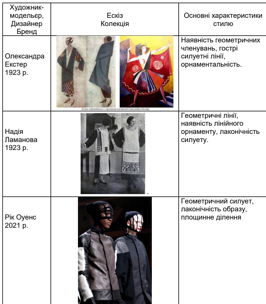
Таблиця 1 - Елементи стилю «конструктивізм»

В табл. 1 представлено основні елементи стилю «конструктивізм» в роботах дизайнерів ХХ–ХХІ століть [3,4].