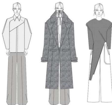
Рис. 1. Ескізи колекції сучасного одягу в стилі «конструктивізм»

Раціональність конструктивізму є актуальною та практичною потребою дизайну сучасного костюма. В результаті дослідження основних характеристик стилю «конструктивізм», за отриманими даними аналізу та візуального порівняння, розроблено ескізи колекції сучасного одягу (рис. 1).