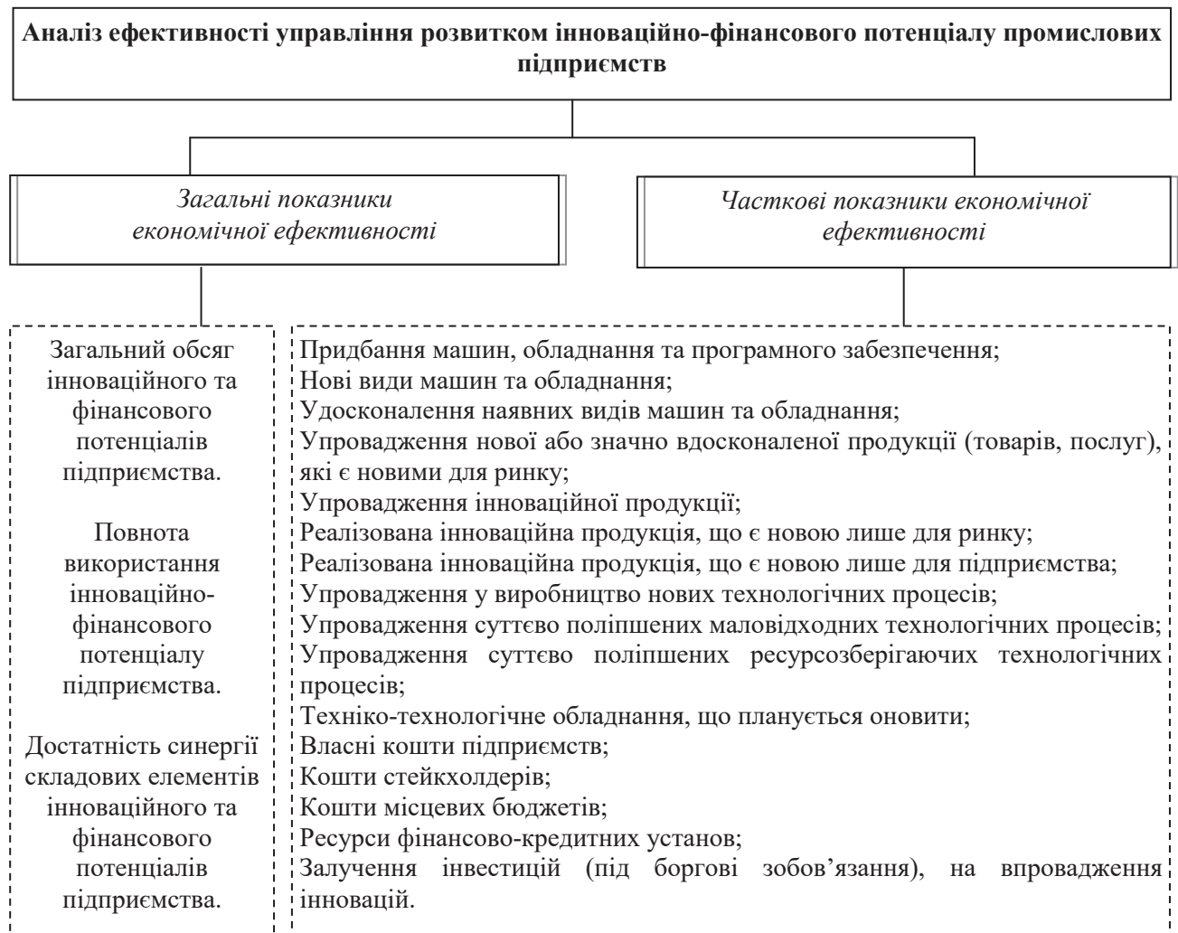
Рис. 1. Показники оцінки ефективності управління розвитком інноваційно-фінансового потенціалу промислових підприємств [21-25]

елементів, а якісні – розглядаються з позиції кількісного аналізу якісних змін (темпи зміни, напрямок і т. ін.), тобто характеризують динаміку змін складових інноваційно-фінансового потенціалу [21-24; 25].