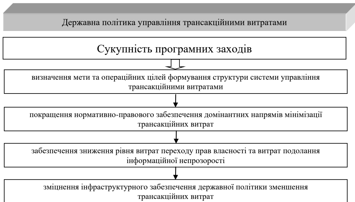
Рис. 3. Механізм управління та напрями державного регулювання трансакційними витратами

Отже, в основі раціональної державної політики в сфері державного регулювання трансакційними витратами є її інституціональне забезпечення, котре можливе при прийнятті визначених програмних заходів та послідовною їх реалізацією.