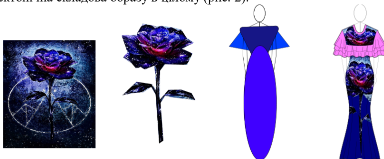
Рис. 2. Поетапне перетворення фесричного об'єкту в модель сукні жіночої

У процесі перетворення разом з формою трансформується і тектонічна складова образу в цілому (рис. 2).