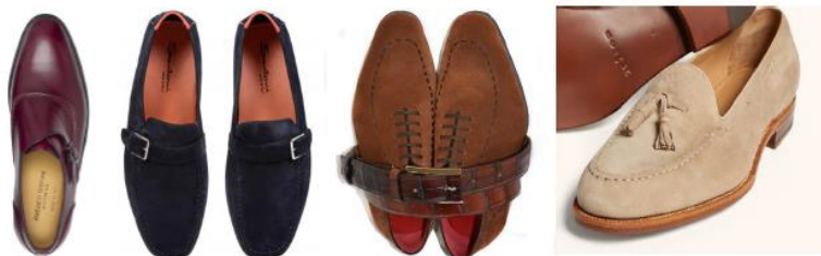
Рис. 1. Моделі взуття преміум брендів

складання заготовок верху та застосовують ниткові методи кріплення деталей низу (рис. 1).