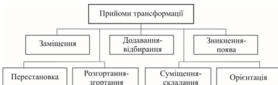
Рис. 11. Класифікація прийомів методу трансформації

В останній моделі використовується прийоми додавання-відбирання та перестановки, за допомогою яких декоративна деталь, що розташована знизу спідниці, та з'ємні рукави можуть прибиратися. Також в цій моделі використовується прийом орієнтації, який полягає в тому, що під декоративною деталлю розташована така ж сама деталь, на якій прикріплюються квіти з підсвіткою