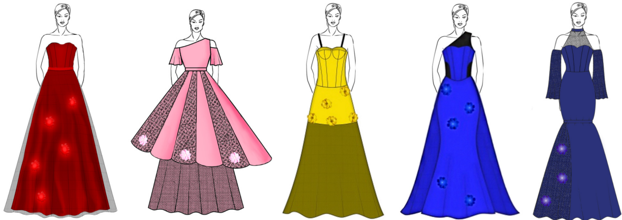
Рис. 13. Творчі ескізи вечірніх суконь (після трансформації)

Таким чином, для зміни зовнішнього вигляду моделей розробленої колекції були застосовані такі прийоми трансформації