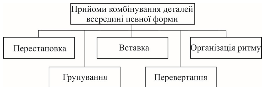
Рис. 3. Прийоми методу комбінаторики щодо комбінування деталей всередині певної форми

Комбінування деталей, пропорційних членувань всередині певної форми рекомендується виконувати на одній конструктивній основі або базовій формі. При розробці моделей використовують такі прийоми як перестановка, вставка, групування, перевертання та організація ритму (рис.3) [2-4].