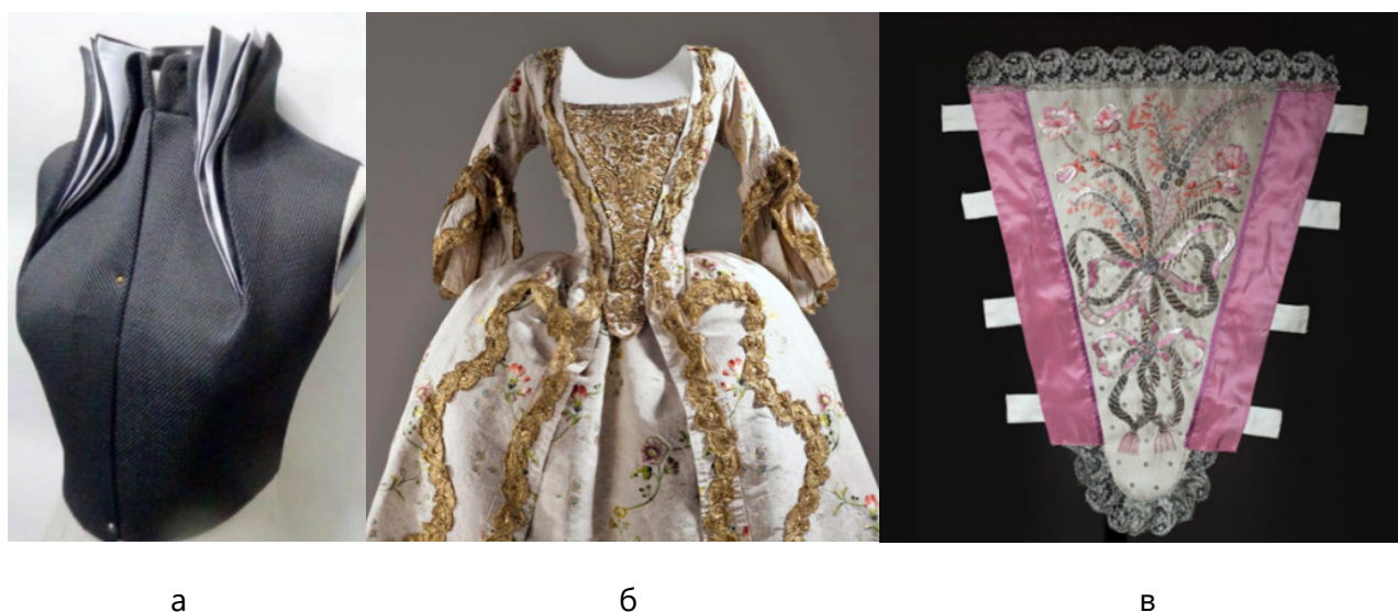
Рис. 5. Використання прийому вставок: а – сучасний виріб; б – історична сукня; в – стомак

листя, профілів, фігур людей тощо) (рис. 5, а). Прийом вставок має історичну основу. Відомо, що він почав використовуватися в період рококо. Тоді одним із обов'язкових компонентів жіночих суконь був стомак, а саме декоративна вставка для корсажу, що звужується донизу (рис. 5, б, в) [2, 7, 10].