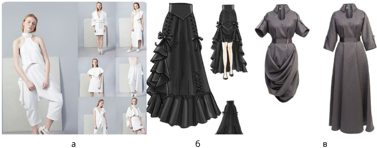
Рис. 9. Використання прийому: а - перестановки; б - зникнення-поява; в - суміщення-складання

кільком рухам. Методи комбінаторики та трансформації мають свої прийоми, які дозволяють досягти швидкої зміни зовнішнього вигляду завдяки використанню нових елементів. Класифікації прийомів вказаних методів, що можуть бути