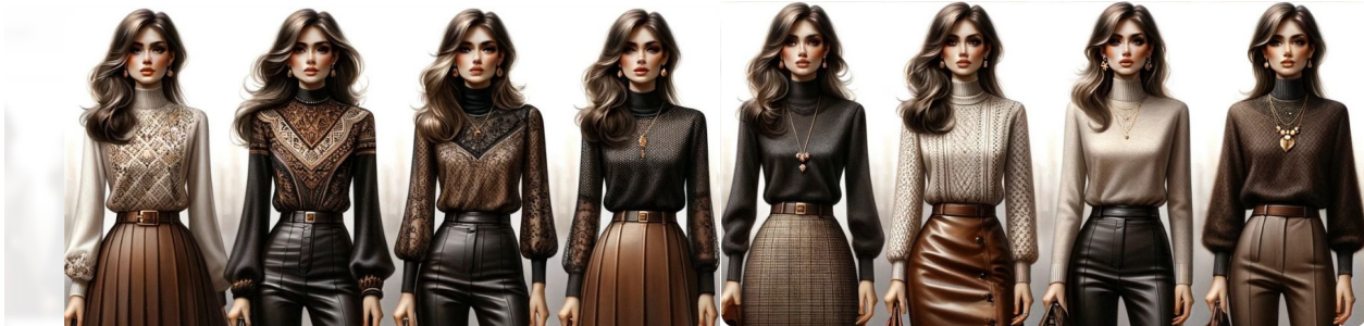
Рис. 6. Приклад прийому пошуку варіантів організації готових комплектів

результаті зміни таких морфологічних властивостей: топологічних, розмірних або конструктивних [3, 4]. Кожен з методів має свої прийоми та особливості застосування.