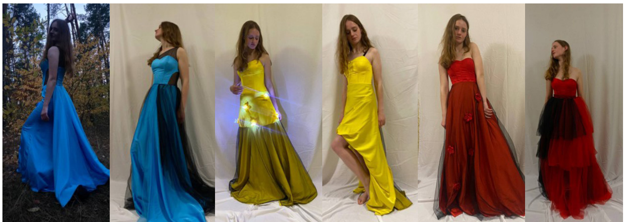
Рис. 14. Моделі вечірніх суконь-трансформерів до та після трансформації

або різних святкових подій. Для збільшення можливостей проєктування одягу, який може замінити декілька речей, були використані такі прийоми як перестановка, розгортання-згортання, зникнення-появи, орієнтації, додавання-відбирання, які є найбільш поширеними відповідно до аналізу напрямку моди. Використання прийомів трансформації і комбінаторики