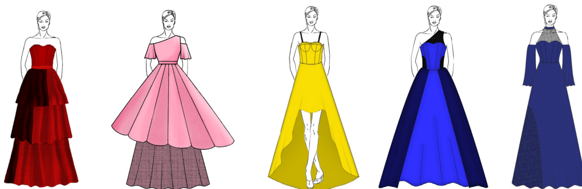
Рис. 12. Творчі ескізи вечірніх суконь (до трансформації)

зі сторони спинки, в результаті чого утворюється шлейф. При цьому відкривається внутрішня спідниця, яка до трансформації була схована під верхньою