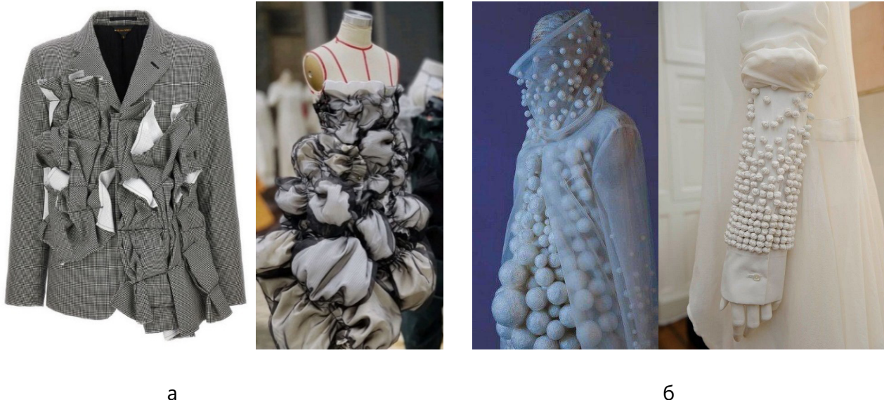
Рис. 4. Використання прийому: а – перестановок; б - організації ритму

Прийом вставок використовується для утворення складної форми з простої. Тобто на будь-якому виробі простого крою виконуються розрізи в будь-якому напрямку та вставляються плоскі елементи тканини простої або складної геометричної форми (у вигляді квітів,