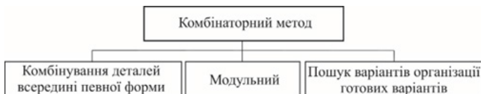
Рис. 10. Класифікація прийомів методу комбінаторики

приховуючи декоративні квіти. Конструкція спідниці розроблена з горизонтальним членуванням, яке розділяє її на коротшу верхню та довшу нижню частини. Завдяки такому підходу є можливість трансформувати виріб та приховати верхню деталь спідниці.