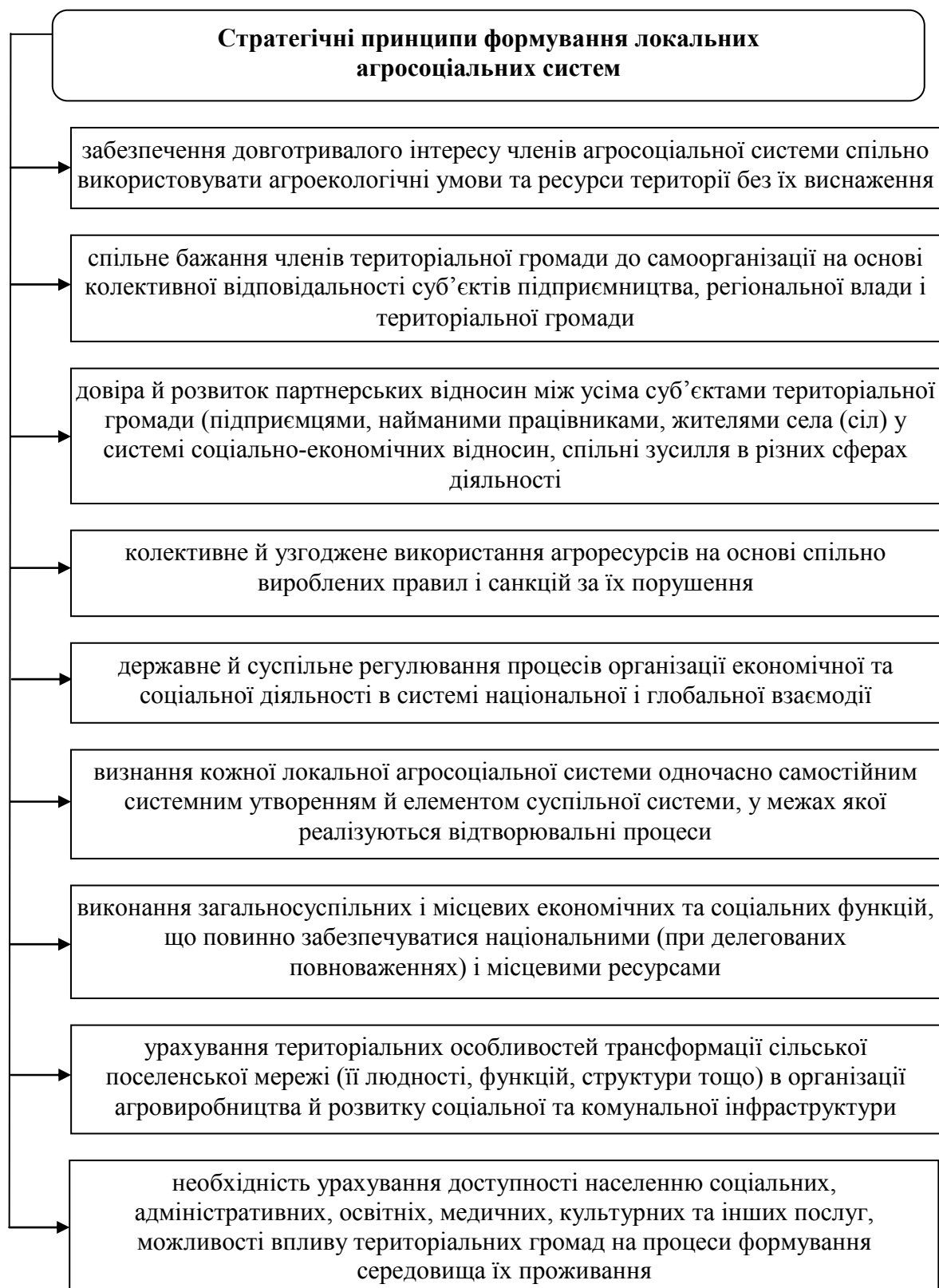
Рис. 2.3. Стратегічні принципи формування локальних агросоціальних систем

добровільною нерегламентованою спонсорською діяльністю підприємців-товаровиробників.