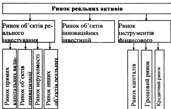
Рис. 1.7. Основні складові інвестиційного ринку

Інвестиційна інфраструктура включає найбільш важливі галузі економіки, установи і засоби, що безпосередньо забезпечують процес безперервного здійснення інвестицій. Підсумовуючи, інвестиційний ринок доцільно розглядати як сукупність окремих ринків (об'єктів реального, інноваційного та фінансового інвестування), у складі якого виділяються: ринок прямих капітальних вкладень, ринок об'єктів приватизації, ринок нерухомості, ринок інших об'єктів реального інвестування, фондовий, кредитний та грошовий ринки (рис. 1.7).