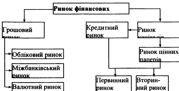
Рис. 1.6. Структура ринку фінансових активів

Ринок фінансових ресурсів на практиці поданий сукупністю кредитно-фінансових інститутів, які є посередниками в процесі направлення потоків грошових коштів від власників до позичальників та назад. Основним завданням ринку фінансових ресурсів є трансформація тимчасово вільних коштів, які є грошовим капіталом та належать таким трьом суб'єктам: юридичним особам, фізичним особам та державі в позичковий капітал на умовах, що зазначені в угоді.