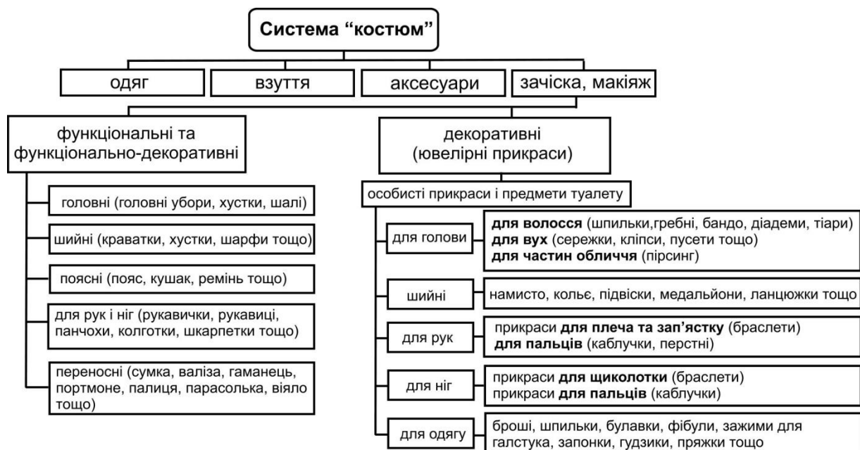
Рис. 1. Елементний склад системи «костюм»

Костюм передбачає наявність певної системи, до основних елементів якої належать одяг, взуття, аксесуари, зачіска і макіяж. Аксесуар (від франц. accessoire , від лат. accessorius – додатковий) доповнення до костюму, який надає йому закінчений вигляд. У моді аксесуар – дуже важлива складова частина образу, стилю одягу. Аксесуари змінюються разом із модою [8]. За призначенням можна виділити функціональні, функціонально-декоративні та декоративні аксесуари (рис.1).