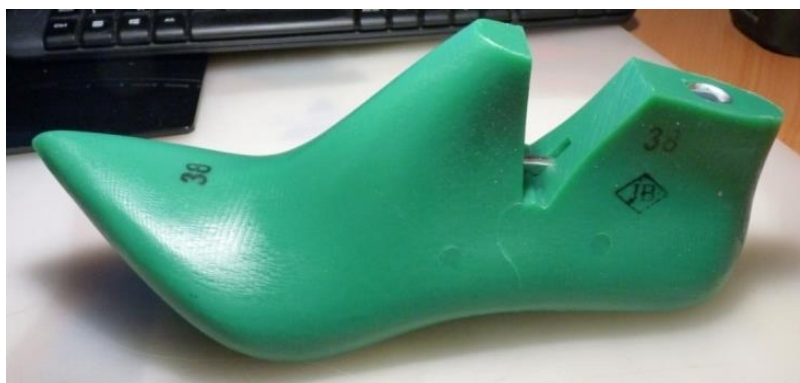
Рис. 2 Виготовлена колодка для модельного жіночого взуття

Висновки. Запропонована в роботі методика дозволяє розробляти нові форми колодок на основі сканованого прототипу з урахуванням індивідуальних антропометричних параметрів стопи замовника та вимог дизайну. Спроектвана форма може бути виготовлена за допомогою верстатів з ЧПК після підготовки спеціальних технологічних програм.