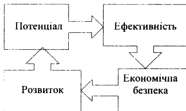
Рис. 13.8. Взаємозв'язок потенціалу, економічної безпеки та розвитку бізнесу (розроблено автором)

саме як результат, досягнення мети). Відповідно, економічна безпека є результатом ефективного використання потенціалу і залежить від нього. Коли економічна система знаходиться у стані захищеності, вона має можливості до власного розвитку, оскільки не витрачає зайвих зусиль на подолання будь-яких перешкод функціонуванню (рис. 13.8).