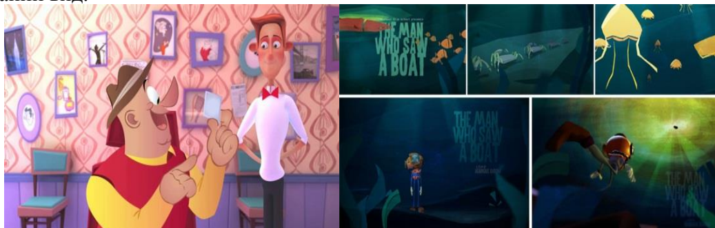
Рисунок 3 - Змішування 3D і 2D графіки

– Змішування 3D і 2D графіки 3D-об'єкти розміщуються в 2D-просторі, інтенсивне використання кутів щоб створити більш графічний, стилізований, і ілюстрований вид.