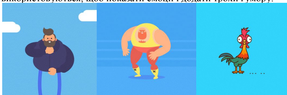
Рисунок 4. Stop кадри GIF зображень в Motion design

– GIFs являють собою відмінний спосіб передати повідомлення в стислій формі і часто використовуються, щоб показати емоції і додати трохи гумору.