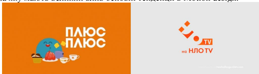
Рисунок 1 - Айдентика телеканалів «Плюс плюс» та «НЛО TV»

Результати дослідження. Motion design часто називають «невидимим мистецтвом» тому, що люди при перегляді, наприклад, теленовин, як би «не помічають» заставок і перебивок до них. Зазвичай заставки деяких видів відеопродукції: серіали, передачі та т.д, глядач сприймає як належне не акцентуючи на цьому вже увагу. Тому в Motion design використовують термін «Айдентика», що відбувся від англійського «Identify» - ідентифікувати, дізнаватися. Саме за допомогою айдентики телеглядачі відрізняють один телеканал від іншого. Айдентика є одним з сучасних напрямів в сучасному Motion design, яка зустрічається у всіх видах відеопродукції, веб-проектів, на яку мають великий вплив основні тенденції в Motion design.